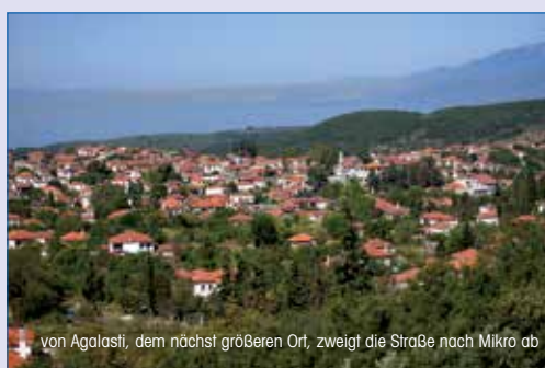
von Agalasti, dem nächst größeren Ort, zweigt die Straße nach Mikro ab