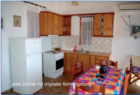
jedes Zimmer mit origineller Namensgebung