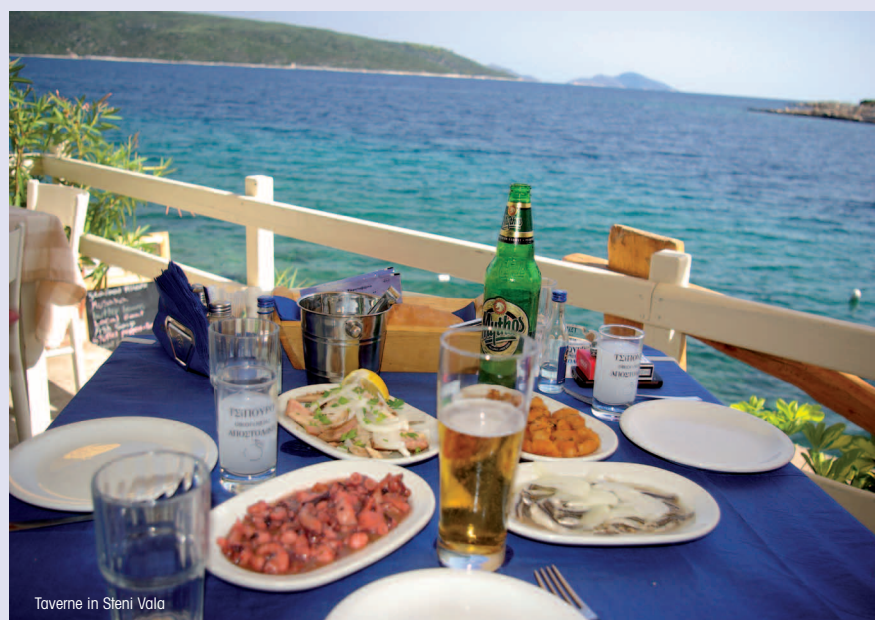
Taverne in Steni Vala

Sehr schön die überdachte, geflieste Balkonterrasse mit Balkonmöbeln. Die moderne Küchenzeile hat eine Basisausstattung an Geschirr und ist mit Kühl-/Gefrierkombination ausgestattet. Zur Anlage gehört ein Barbequeplatz.