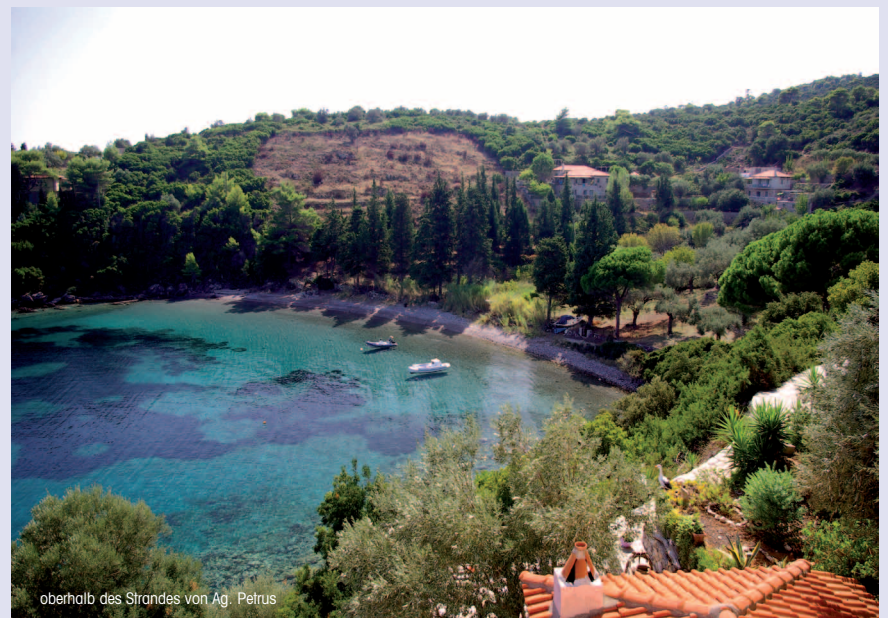
oberhalb des Strandes von Ag. Petrus

Ein schöner separater Außenplatz mit Sitzmöbeln und Tischen sowie Barbecueeinrichtung und fantastischem Ausblick steht den Gästen zur Verfügung. Hier wird bei entsprechendem Wetter auch das hausgemachte Frühstück den Wünschen der Gäste entsprechend, serviert. Schlechter Zustand des kleinen Zufahrtswegs. Der Besitzer fährt übrigens die Buslinie zwischen Patitiri und dem alten Hauptort und spricht deutsch! Sehr herzliche Gästebetreuung. Auf dem Grundstück gibt es eine private Kapelle.