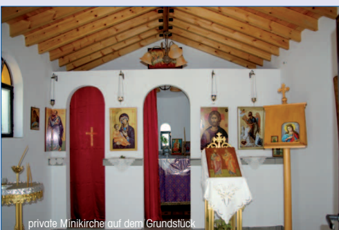
private Minikirche auf dem Grundstück