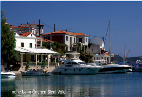
nahe beim Örtchen Steni Vala