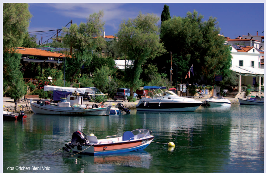
das Örtchen Steni Vala

Das 2011 neu erbaute, moderne Hotel Jahreszeiten liegt nur 300m vom Strand und dem Ortszentrum entfernt. Die insgesamt 20 Zimmer sind anspruchsvoll und geschmackvoll eingerichtet, ein schönes Design machen dieses Hotel zu einem besonderen Angebot. Es gibt sowohl etwas größere Zimmer im Erdgeschoss für maximal 3 Personen und 1 Kind, als die etwas kleineren Zimmer für 2 Personen und 1 Kind im ersten Stock. Die Zimmer oben haben schöne Holzdecken, es gibt Zimmer mit Doppel- als auch mit 2 Einzelbetten. Die Zimmer oben haben Balkon, unten gibt es eine gemauerte, kleine Terrasse mit Tisch und 2 Stühlen. Einige Zimmer sind behindertengerecht eingerichtet, mit extra breiten Türen und ohne Stufen. Alle Unterkünfte haben Klimaanlage, SAT-TV und Duschbad mit abgeteilter Dusche. Auf dem Hotelgelände gibt es einen kleinen Spielplatz. Das Restaurant hat eine überdachte Veranda, hier wird auch das Frühstück serviert.