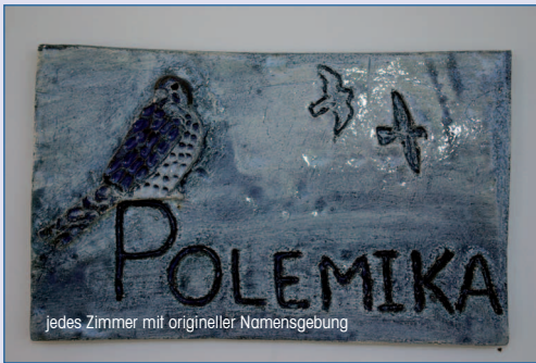
Jedes Zimmer mit origineller Namensgebung