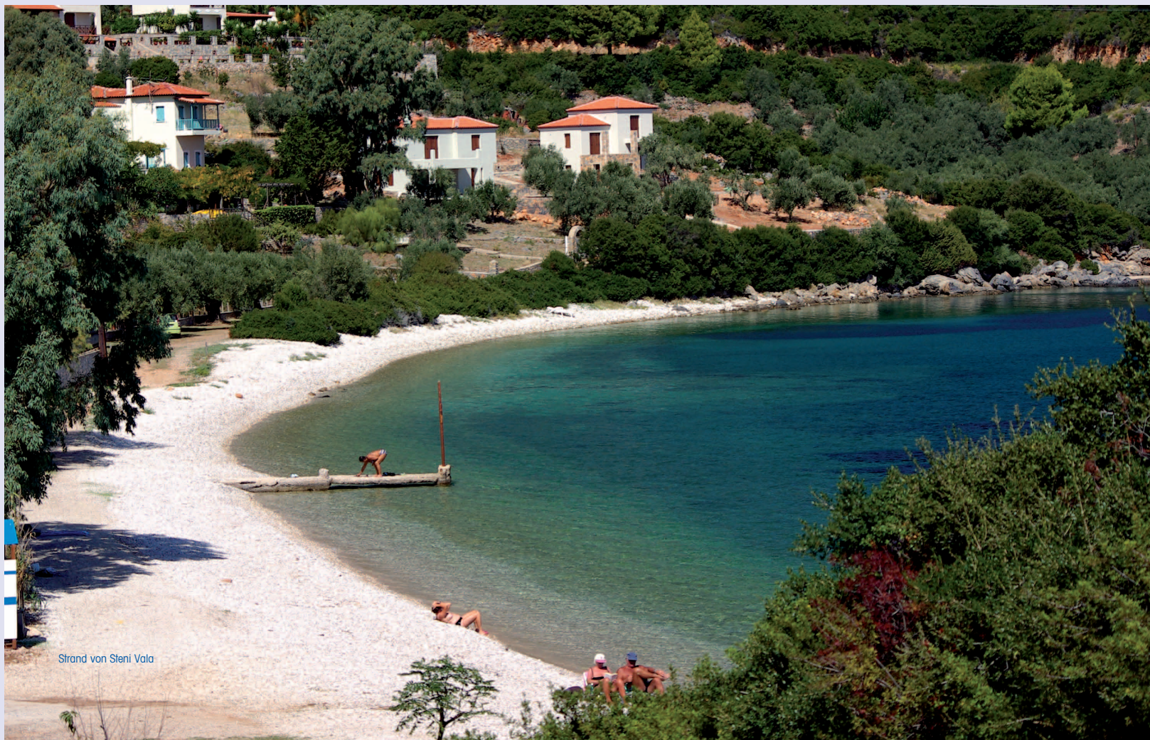
Strand von Steni Vala

Modernes, ansprechendes Design geben den besonderen Rahmen für dieses kleine Boutiquehotel in dem Fischerdorf Steni Vala. Die Tavernen des Ortes und der Strand sind nur etwa 300m vom Hotel entfernt.