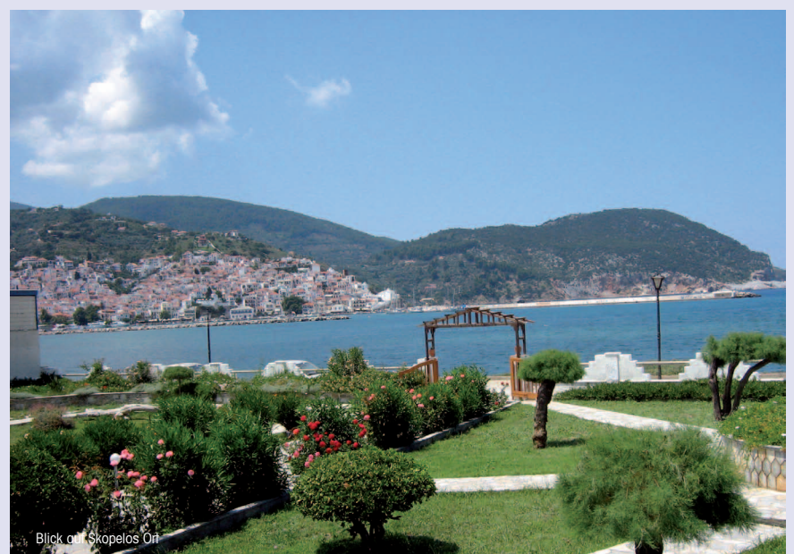
Blick auf Skopelos Ort