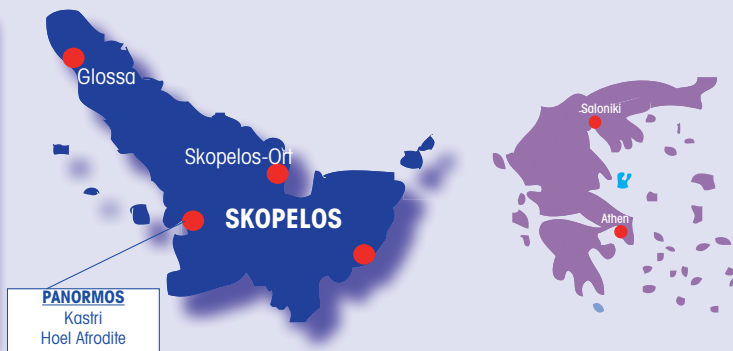
PANORMOS Kastri Hoel Afrodite