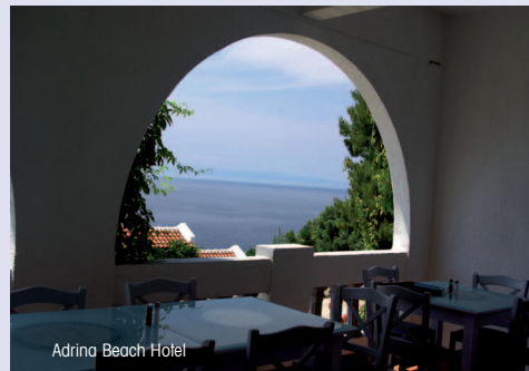
Adrina Beach Hotel