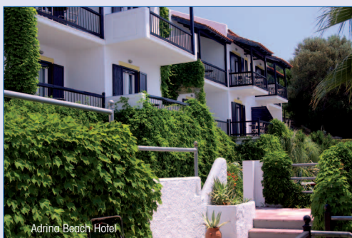
Adrina Beach Hotel