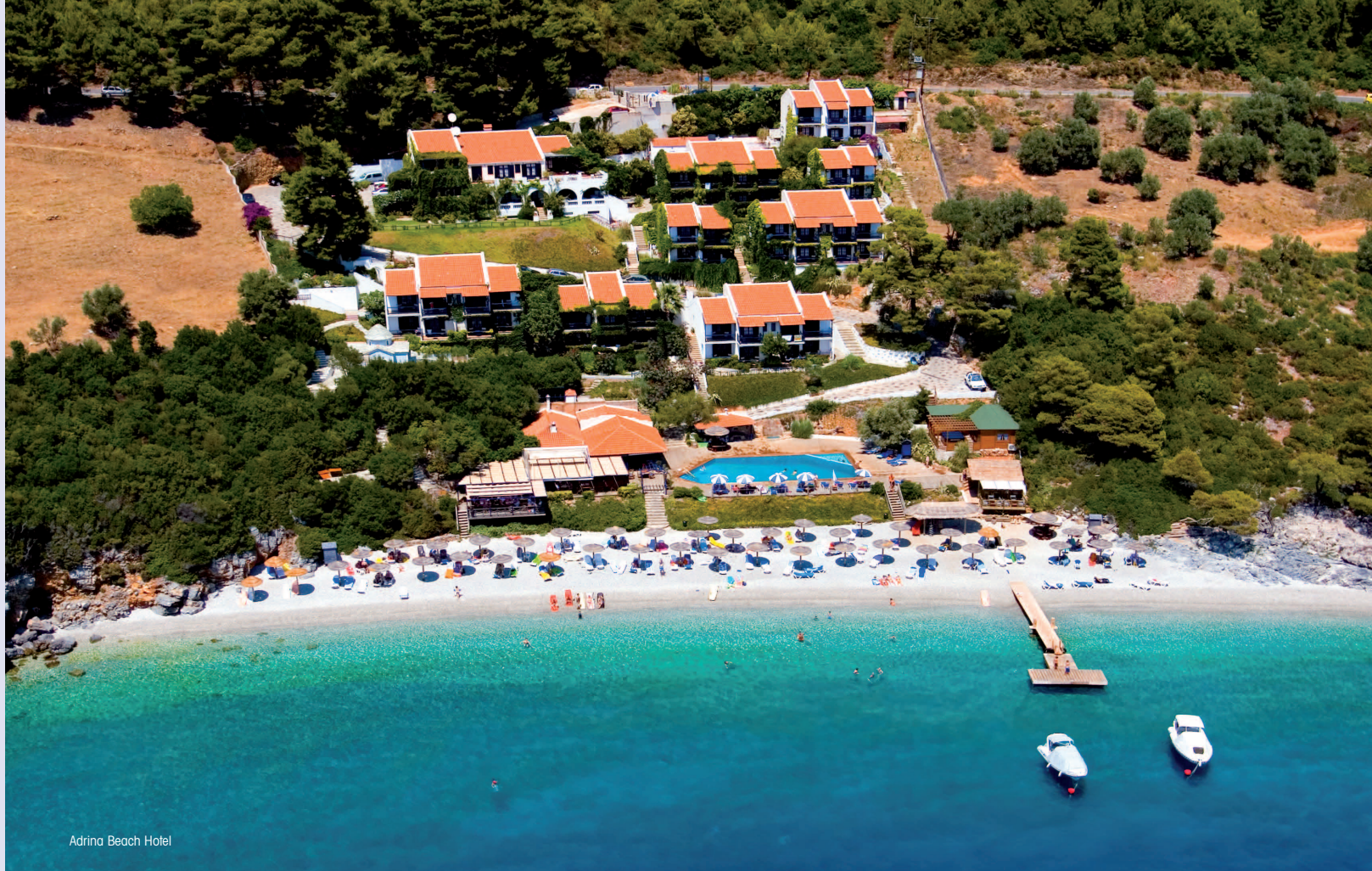
Adrina Beach Hotel