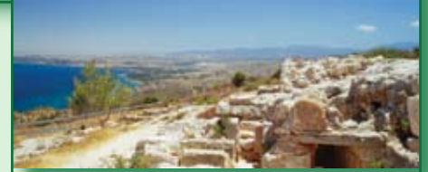
Ausgrabung von Vouni

Bäder, Säulengänge, Theater und vieles mehr.