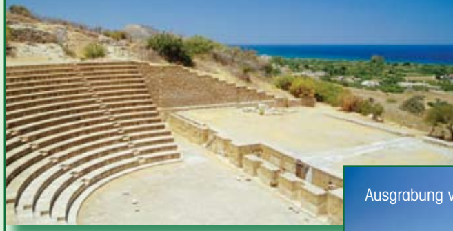
Theater von Soli

durch seine Lage auf einem Bergplateau und spektakuläre Blicke auf das Meer beeindruckt. Genießen Sie hier einen unvergesslichen Sonnenuntergang inmitten der Ausgrabungen.