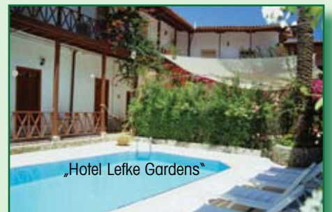
„Hotel Lefke Gardens“

Am Nachmittag führt Sie die Tour in den Nordosten auf die landschaftlich einmalige Karpatz-Halbinsel. Ein großer Teil ist zu Recht als Naturschutzgebiet ausgewiesen: Dünenlandschaften und leere Strände, kleine ursprüngliche Dörfer, in denen die Zeit still zu stehen scheint, einsame Wege, die durch Berglandschaften und