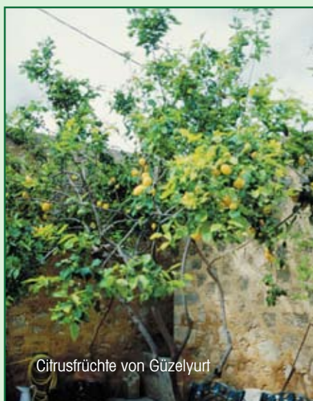
Citrusfrüchte von Güzelyurt