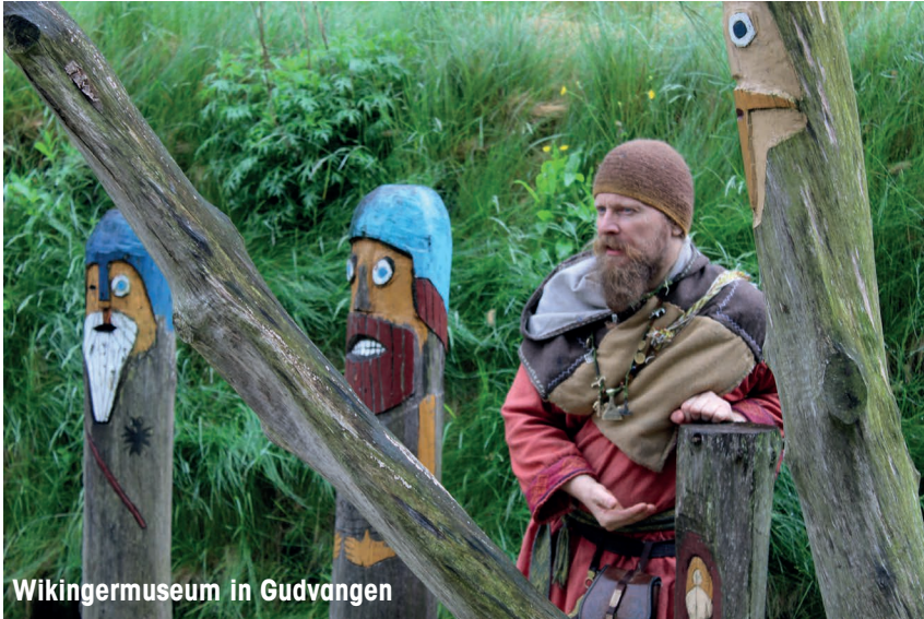
Wikingermuseum in Gudvangen