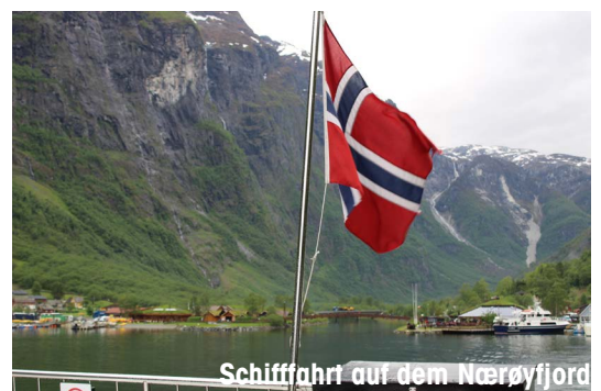
Schiffahrt auf dem Nærøyfjord