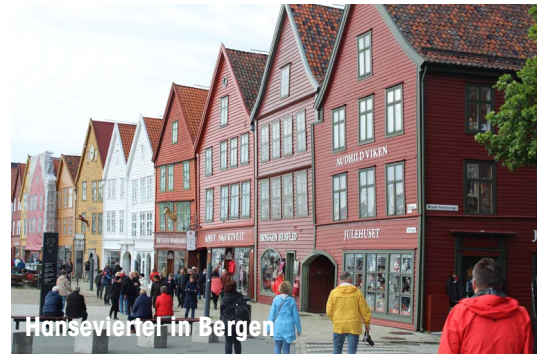
Hanseviertel in Bergen