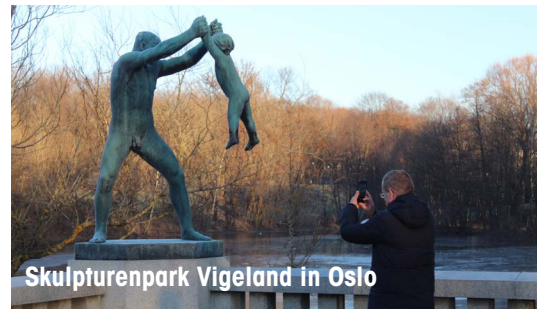
Skulpturenpark Vigeland in Oslo