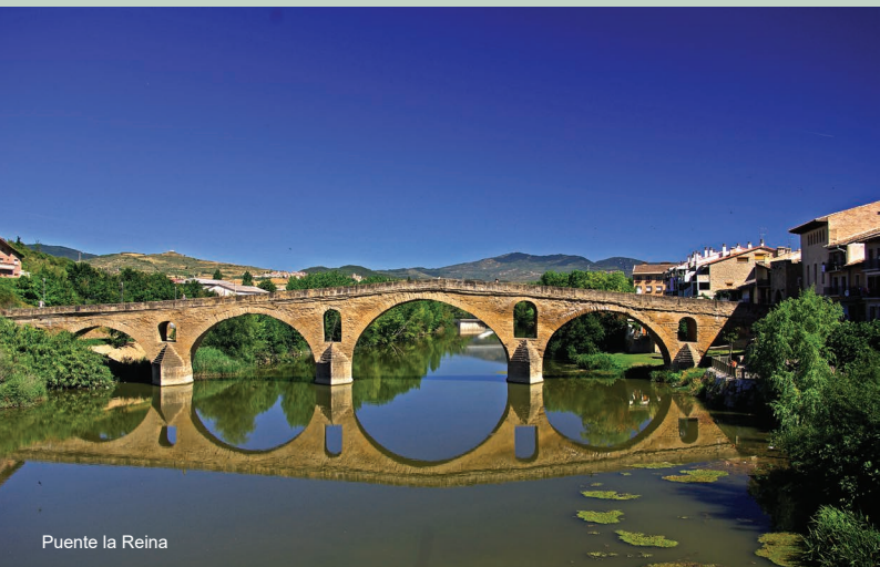
Puente la Reina