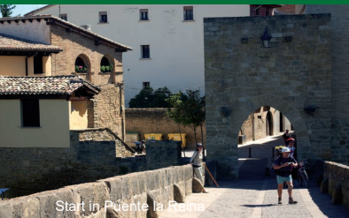
Start in Püente la Reina