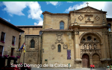
Santo Domingo de la Calzada