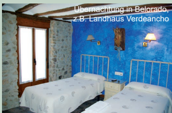
Übernachtung in Belorado, z.B. Landhaus Verdeancho

Die Etappen: Ankunft und 1. Nacht in Pamplona. 2. Tag Puente la Reina (23 km). 3. Tag Estella (22km), 4. Tag Los Arcos (23 km), 5. Tag Logrono (29 km). 6. Tag Najera (29km), 7. Tag Santo Domingo (21km), 8. Tag Belorado (24 km). 9. Tag San Juan de Ortega (23 km), 10. Tag Burgos (28 km).