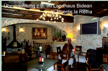
Übernachtung z.B. im Landhaus Bidean in Puente la Reina

volle Kapelle von Eunate, eines der ältesten Benediktinerklöster Navarras, Santa Maria la Real de Irache und die gewaltige Kathedrale von Burgos sind nur Beispiele der unzähligen sakralen und weltlichen Bauwerke. Dazu durchqueren Sie eines der bekanntesten Gebiete Spaniens, das Rioja mit hervorragenden Weinen!